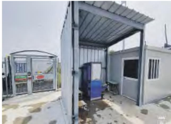
TITO Il nuovo centro di raccolta rifiuti

inseriti in un catalogo del Comune di Tito al quale si potrà fare domanda con un modello pubblicato sul web. «Abbiamo voluto realizzare – dichiara il sindaco Graziano Scavone - una infrastruttura che integra e ottimizza il nostro sistema di gestione dei rifiuti urbani offrendo agli utenti la possibilità di poter accedere ai servizi di conferimento nel centro in più giorni della settimana». Il centro sarà aperto il lunedì, mercoledì, giovedì e sabato di mattina, dalle ore 8 alle ore 11, il martedì e il venerdì di pomeriggio dalle ore 14 alle ore 17. Non sono ammessi i rifiuti non differenziabili, speciali o pericolosi. I rifiuti dovranno essere asciutti e separati e non è ammesso lo scarico di rifiuti mescolati tra loro.