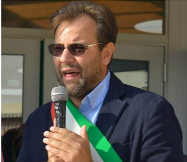
Il Sindaco di Tito, Graziano Scavone

Articolo completo: https://www.ufficiostampabasilicata.it/ambiente-e-territorio/tito-gravi-disagi-per-i-disservizi-nellerogazione-idrica-il-sindaco-scrive-ad-acquedotto-lucano/