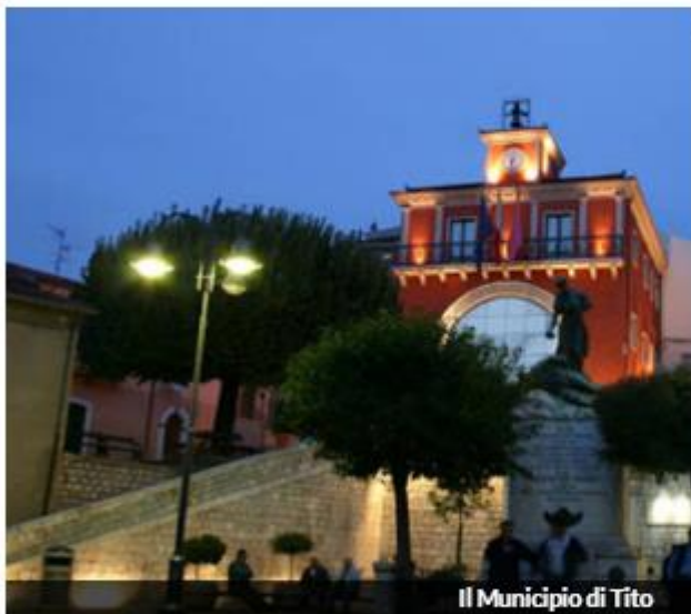
Il Municipio di Tito