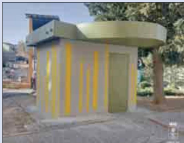
L'area giochi riqualificata

gamento della strada limitrofe alla filiale delle Poste con l'area residenziale sottostante. Nei prossimi mesi, unitamente ai lavori di efficientamento energetico della illuminazione pubblica, sarà potenziata la luminosità dell'intero parco ed i sistemi di videosorveglianza già presenti. "Stiamo portando avanti - ha dichiarato il sindaco