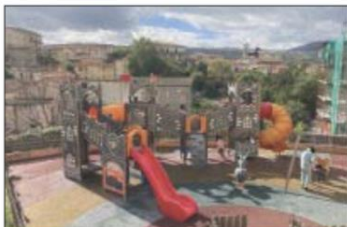
In foto il parco riqualificato

TITO- Apre a Tito una nuova area per bambini. Sono stati, infatti, completati i lavori di riqualificazione e sistemazione del parco giochi di località San Vito, con interventi che hanno rimosso anche le situazioni di degrado all'interno del parco. Si è provveduto - fa sapere il sindaco Graziano Scavone - a disinstallare l'attrezzatura ludica posizionata al centro del parco, di fatto oggetto di continui atti vandalici e situazioni degradanti, interessata da ripetuti interventi di manutenzione riparativa effettuati dall'amministrazione comunale nel corso degli anni, si è stati costretti a rimuovere definitivamente eliminando così una delle fonti di degrado dell'area. Si è proceduto, inoltre, a risistemare l'attrezzatura ludica dedicata ai più piccoli, a rimuovere situazioni di pericolo ed a riqualificare i bagni pubblici a servizio della popolazione più anziana ed in particolare dell'utenza dei servizi postali. I servizi igienici saranno ora fruibili e accessibili attraverso l'utilizzo del-