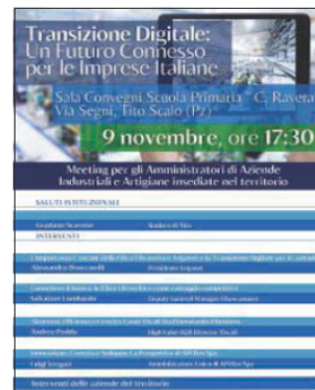
In alto la locandina dell'iniziativa

Si tratta in particolare di un importante appuntamento, un meeting, per gli amministratori di aziende industriali e artigiane insediate sul territorio. A conclusione dell'evento, a seguito degli interventi dei rappresentanti delle aziende del territorio, verrà servito un aperitivo con i prodotti tipici locali.