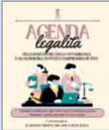
La locandina dell'iniziativa